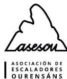
Asociación de Escaladores Ourensáns (ASESOU)