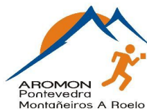
Club Montañeros de Pontevedra