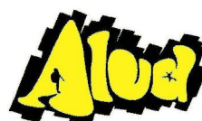
Grupo de Montaña Alud