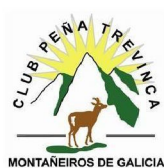
Club Peña Trevinca - Montañeros de Galicia