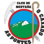
Club de Montaña O Caxado