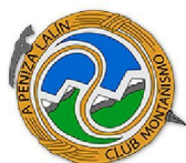
Clube de Montañismo A Peniza