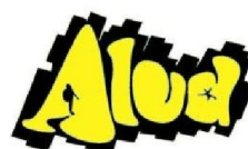
Grupo de Montaña Alud