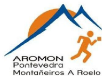
Club Montañeros de Pontevedra