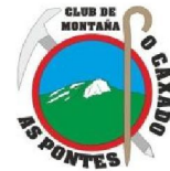
Club de Montaña O Caxado